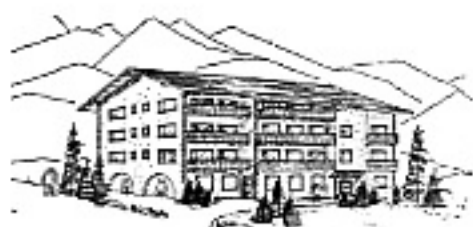
HOTEL ALBANA 7513 SILVAPLANA